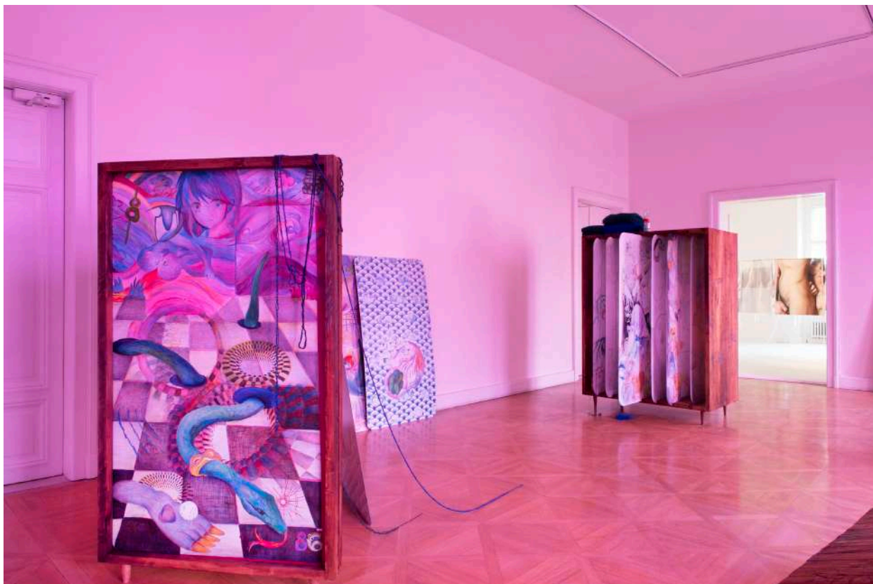
Björnsonova, instalace 12 Čosity karet: Just a Few Moments Ago, We Were Waiting for Ages, výstava Cena Jindřicha Chalupeckého 2021