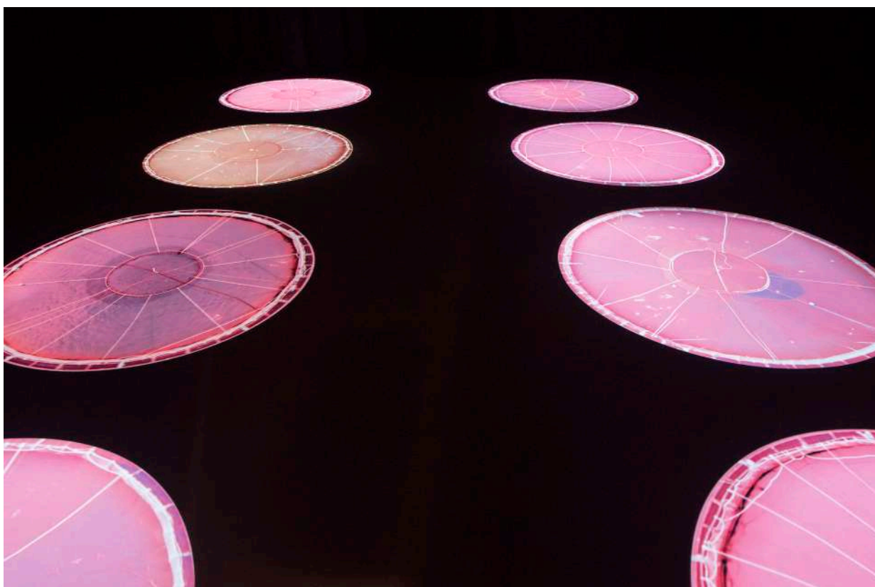
Cooking Sections – Salmon – The Traces of Escapees, instalace s 8 kanálovou projekcí